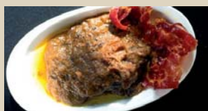
XVII DON JABUGO "CARRILLERA DE CERDO IBÉRICO AL VINO TINTO" Zabaltza, 8