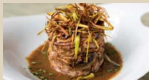
XI ALTZOLA "NERON" Eguzkitzaldea, 8