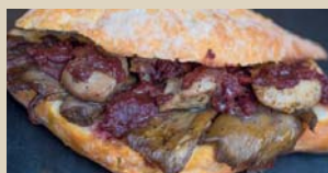
IV TXINGUDI RUGBY TABERNA "ENSAYO DEL MELLITIS PORCUS" Nagusia, 11