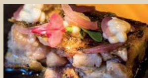
V MANOLO "PORCUS MAGNIFICUS" Nagusia, 13