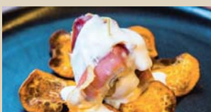
IX SWING BERRI "CHAMPIÑONES CON JAMÓN Y ALIOLI" Santiago, 46