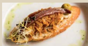
VIII MARKEN "PULS" Santiago Kalea, 27