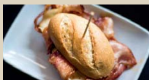
I GAZTELUMENDI "MONTADITO DE PANCETA" San Juan Arria, 3