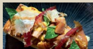
XIX BAKAR "GARUM PORCUS"