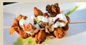
VI MARI "PULLUM CRUNCHY" Fueros, 7