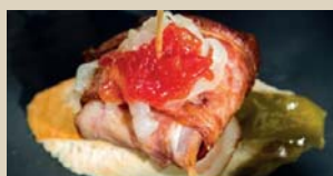
VII EL BULE "OIASSO" Santiago, 53