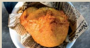
X ESKINA "MIXTUM" Urdanibia, 1