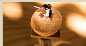
XII DANAKO "BOLUM" Alzukaitz, 1