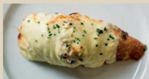
XIV NAROA "TOSTA DE QUESOS GRATINADOS CON MIEL Y NUECES" Iparralde Hiribidea, 5