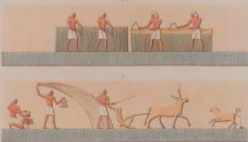
TABLEAU PRÉPARE PAR LE PEUPE DE LA SAHARA DES HERRIS DANS LE S. TERRAIN DES HERRIS. C. EST. 25. PEUPE DE C'UNE DES SAHARA DE NERE TERRAIN.